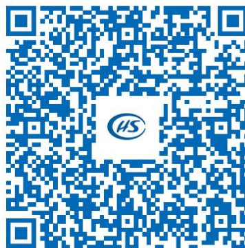
陕西医保公共服务平台单位 网厅操作攻略